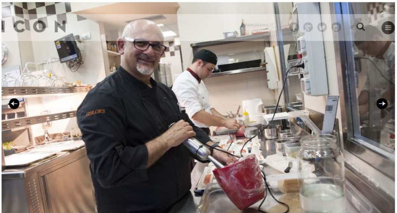
Lo chef Claudio Sadler all'opera nel suo ristorante milanese.